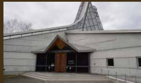
平取町立アイヌ文化博物館

旧石器時代から縄文・続縄文時代を経て擦文時代に至る重複遺跡で、釧路湿原を望む台地上に縄文・続縄文時代の浅い円形・楕円形竪穴102軒、擦文時代の四角形竪穴232軒がくぼんだ状態で残されています。