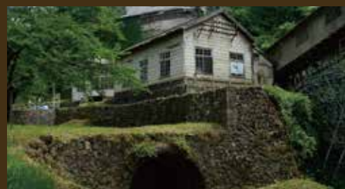
佐渡金山鉱山事務所跡

両津湾は佐渡の東北に深く入り込んだ両津湾の最奥部に位置し、古くは夷港と呼ばれ商・漁港として栄えてきました。