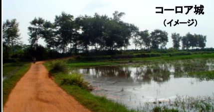
コーロア城 (イメージ)