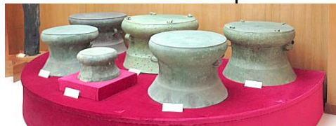
タインホア省博物館(イメージ)