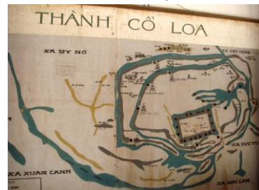
コーロア城 (イメージ)