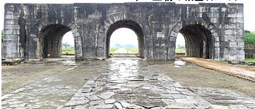
ホー王朝の城塞(イメージ)