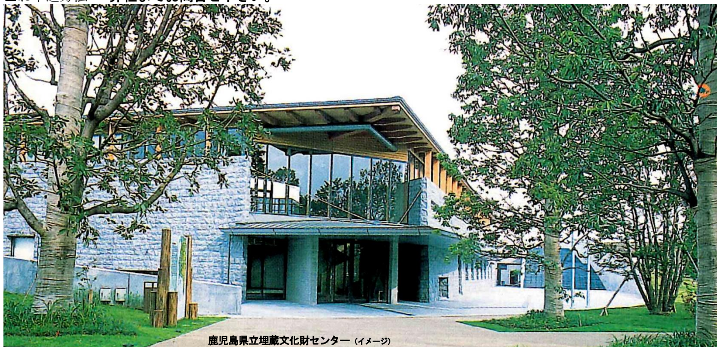
鹿児島県立埋蔵文化財センター（イメージ）