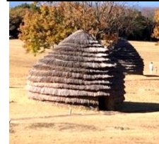
上野原遺跡（イメージ）