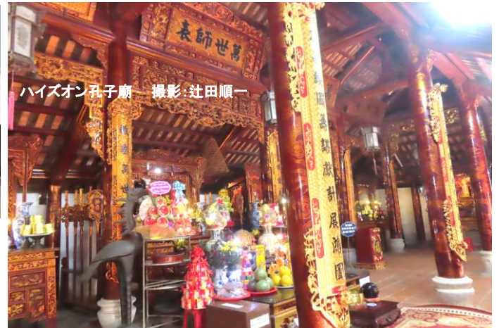
ハイズオン孔子廟