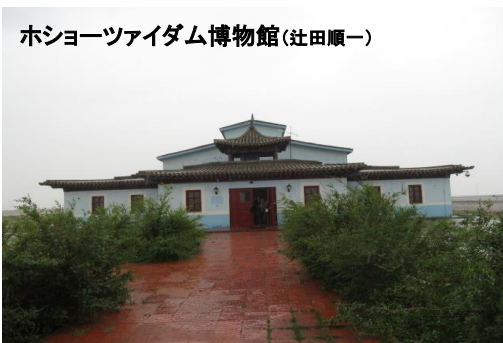
ホショーツアイダム博物館(辻田順一)

※上記日程は現地事情(天候、交通機関の遅延、訪問先施設等の諸事情)によりやむなく変更または中止となる場合があります。