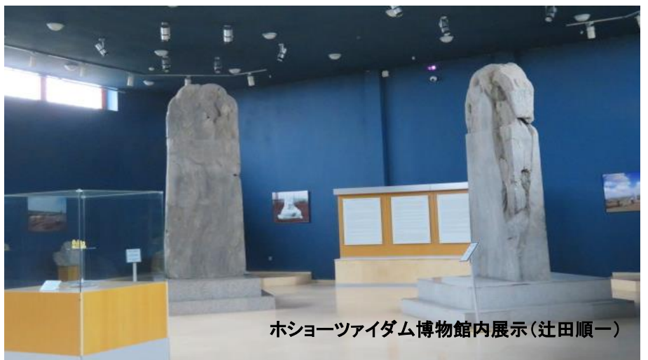
ホショーツアイダム博物館内展示(辻田順一)