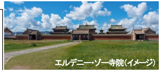
エルデニー・ゾー寺院(イメージ)