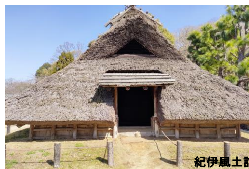
紀伊風土記の丘(イメージ)