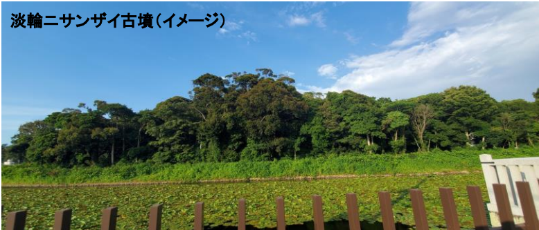
淡輪ニサンザイ古墳(イメージ)

※上記の日程は、現地事情(天候・交通機関・訪問先などの諸事情)で変更される場合があります。