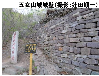
五女山城城壁