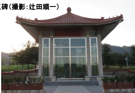
好太王碑