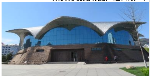
集安博物館