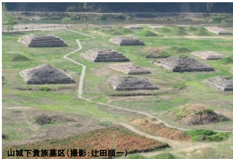
山城下貴族墓区