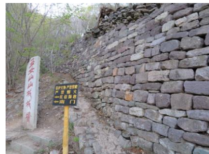
五女山城城壁