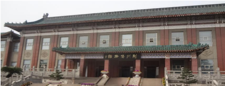
荊州博物館 (撮影：辻田順一)

※上記日程は現地事情(天候、交通機関の遅延、訪問先の諸事情)によりやむなく変更または中止となる場合もあります。