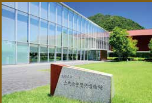
島根県立古代出雲歴史博物館

帝釈峡の周辺一帯の石灰岩地には、長年の浸食によって多くの洞窟・岩陰ができ、先史時代の人類遺跡が随所に残され「帝釈峡遺跡群」と呼ばれています。今回のツアーではこの中で「帝釈峡馬渡遺跡」「寄倉岩陰遺跡」などを見学します。