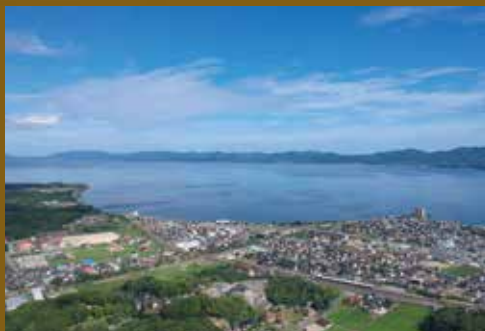
宍道湖周辺の遺跡

出雲大社のすぐ東隣に位置する大型のミュージアムで、出雲大社や島根県の歴史や文化を紹介しています。日本中を驚かせた 358 本もの荒神谷遺跡の銅剣(国宝)や、1 か所からの出土数では全国一の加茂岩倉遺跡の銅鐸 39 個(国宝)などを展示しています。